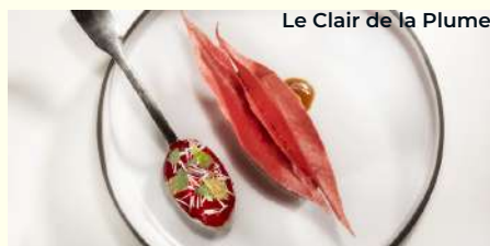
Le Clair de la Plume